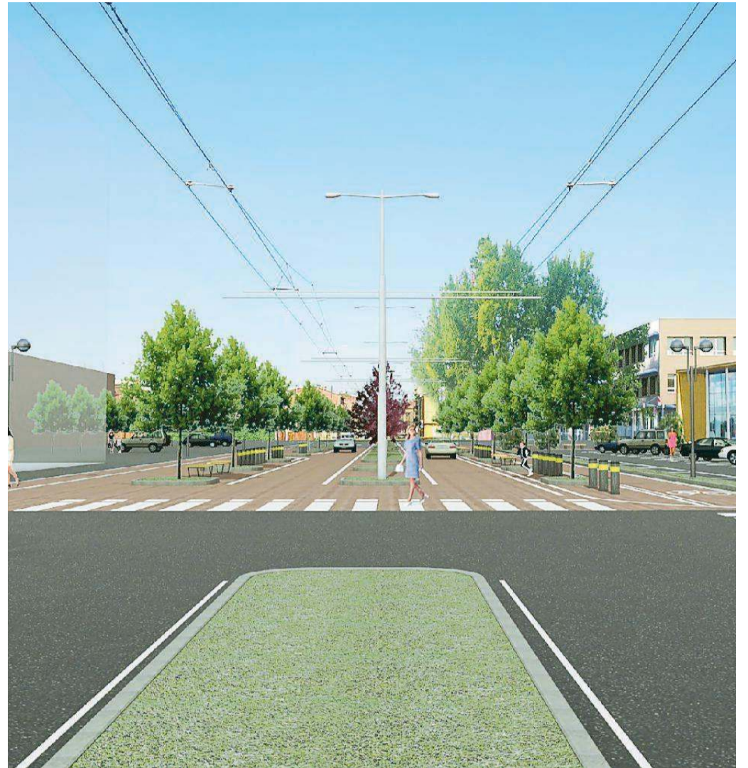
Come sarà l'area di via Canaletto una volta che sarà riqualificata la zona con nuove tecnologie

Ma quali saranno le sedi della kermesse del digitale? I luoghi sono tanti, e coincidono con le piazze e gli edifici più significativi della città, da piazza Grande a piazza Mazzini, da Palazzo Ducale alla Galleria Europa, passando per la Fondazione San Carlo. Tra le tematiche che verranno sviluppate nelle tre giornate di festival spiccano alcuni progetti direttamente coinvolti nello sviluppo della città nei prossimi anni, a partire da Masa (Modena Automotive Smart Area), progetto sperimentale per lo sviluppo della mobilità “smart” e della guida autonoma, che nasce dalla partnership fra Comune