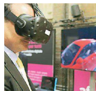
La realtà virtuale

Dalla “Smart education” dalla “Città sostenibile”, dal “Lavoro nel futuro” al “Digitale per tutti”, dallo “Scopri e gusta il territorio” allo “Sperimenta il digitale”: sono sei le aree tematiche in cui si articolerà il festival “#Future Modena 018 - Smart life”, che dal 28 al 30 settembre trasformerà la città (insieme a Carpi e al Distretto ceramico) nella capitale della cultura digitale. Ad aprire i lavori sarà un convegno, nella mattinata di venerdì 28 settembre, sulla Data economy, in collaborazione con Confindustria Emilia e Cyber security academy: al centro ci saranno l'evoluzione del lavoro con il digitale, l'uso massiccio dei dati, i rischi della sicu-